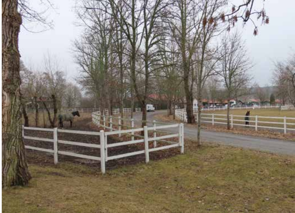
From Above ja Calgary Games viettävät päivää omissa aitauksissaan