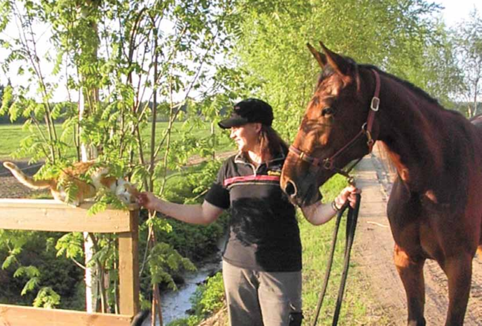
Sari, Global United ja Ruttukissa.