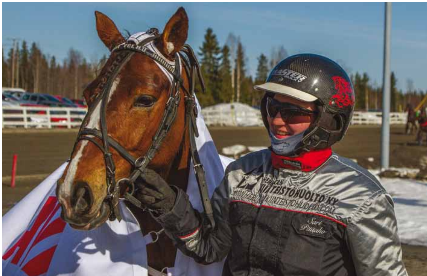
Inferno eli Velmu: "pieni ruuna, suuri sydän".